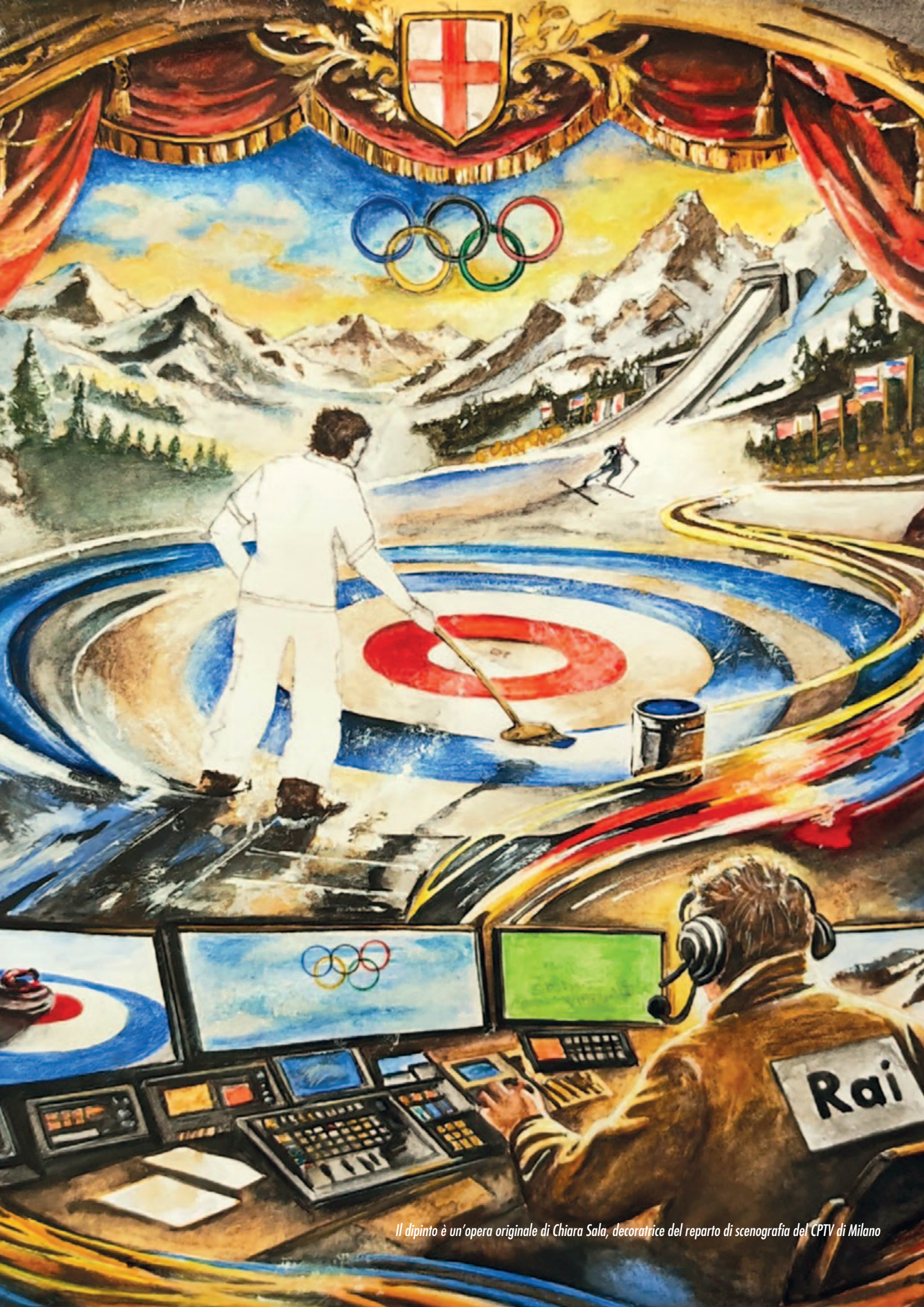
Il dipinto è un'opera originale di Chiara Sala, decoratrice del reparto di scenografia del CPTV di Milano