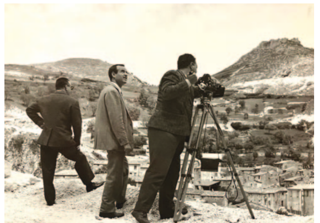
Le riprese a Roccamandolfi (1961)

“Avrei voluto fare, negli anni tra i 50 e i 60, una raccolta visiva delle tradizioni popolari italiane: folklore, tradizioni, festività... una grande teca