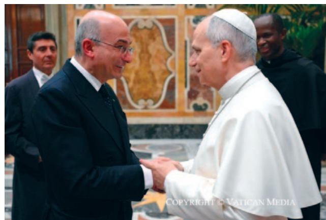
L'incontro tra Papa Leone e Antonio Preziosi

ria Grazia Capulli e Tg2 Weekend , oggi condotta da Adele Ammendola , con suggerimenti pratici su eventi culturali e borghi da visitare nel fine settimana.