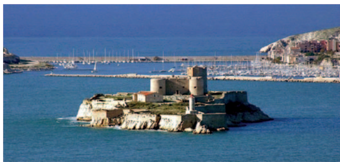
"Le chateau d'If", prospiciente il Vecchio Porto di Marsiglia, ha rinchiuso l'innocente Edmond Dantes per 14 anni, alimentando la sua sete di vendetta.