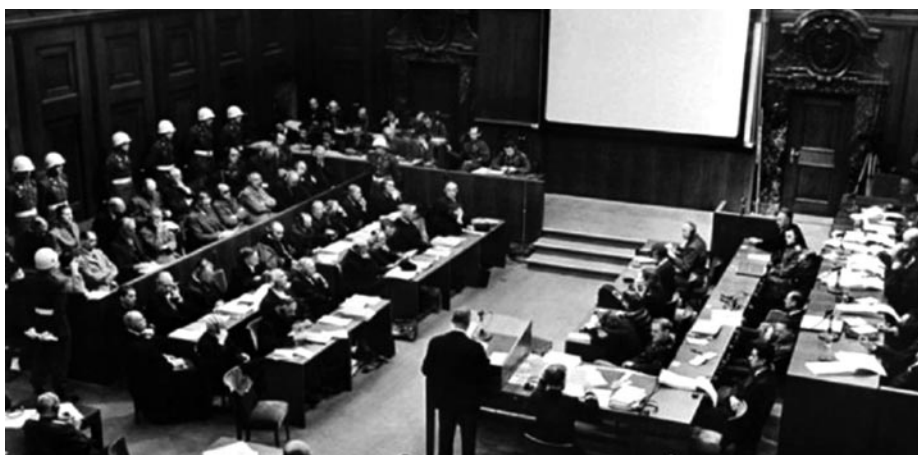
Il processo di Norimberga ha dato un contributo decisivo al ripristino dell'ordine internazionale dopo la Seconda Guerra Mondiale

I l mio primo contatto con il “mondo di Montecristo” ha una data precisa, il 1951. In quella estate si verificò il mio primo viaggio da Milano in Francia per visitare i nonni materni, le sorelle della mamma, i numerosi cucini. In effetti tutta la famiglia di mia madre era emigrata varcando la frontiera allora ben presidiata di Pont Saint Louis, tra la Liguria e la Costa Azzurra ai primi del '900 e, passata la tempesta della Seconda Guerra Mondiale, si sentiva il bisogno di riannodare le fila. Così eccoci in quella estate a