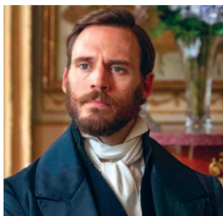
L'attore inglese Sam Claflin ha dato il proprio volto al Conte di Montecristo nella recente serie televisiva diffusa dalla Rai.

storia di Montecristo è esemplare perché il “veleno” della vendetta in questa storia viene somministrato a poco a poco, in modo da far soffrire il più possibile i colpevoli.